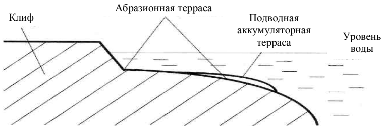
Рис. 2.2. Абразионное развитие берега

Интенсивность абразии зависит от степени волнового воздействия, т. е. от бурности водоема. Важнейшим условием, предопределяющим абразионное развитие берега, является относительно крутой угол исходного откоса (больше 0,01) прибрежной части дна моря или озера. Абразия создает на берегах абразионную террасу или бенч (англ. bench ), и абразионный уступ или клиф (рис. 2.2). Образующиеся при этом в результате разрушения горных пород песок, гравий, галька могут вовлекаться в процессы перемещения наносов и служить материалом для образования береговых аккумуляторных форм. Часть материала сносится волнами и течениями к подножью абразионно-подводного склона, образуя прислоненную аккумуляторную террасу. По мере расширения абразионной террасы абразия постепенно затухает (так как расширяется полоса мелководья, на преодоление которой расходуется энергия волн) и при поступлении наносов может смениться аккумуляцией.